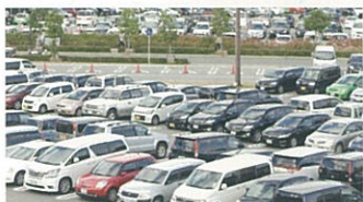
大型駐車場での誘導