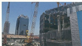
建設現場の作業連絡