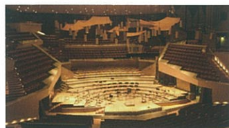
大規模イベント会場での連携

標準価格 134,400円(本体 128,000円) 付属品: 設定用リモコン/DC電源ケーブル 取付け金具/Uボルト