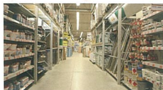
物流センターでの業務連絡