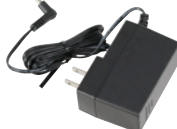
★充電器用ACアダプタ SK-P55