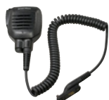
防水スピーカーマイク SK-M52 別売: SK-M52用イヤホンSK-E51