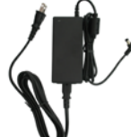
連結型充電器用ACアダプタ SK-P58