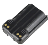
電池パックL (3350mAh) SK-P53