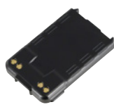
電池パックS (1200mAh) SK-P51